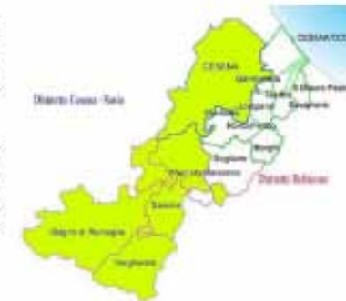
Variatione percentuale della popolazione residente per Comune Comprensorio Cesenate (2001-2006)

I cambiamenti nella struttura demografica della popolazione, in linea con il contesto regionale, nazionale ed europeo sono rappresentati dall'invecchiamento della popolazione, il costante aumento di cittadini di origine straniera e la leggera ripresa della natalità.