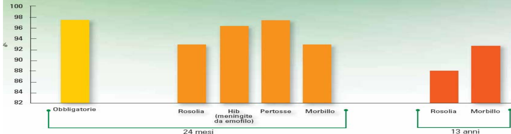
Le vaccinazioni nell'infanzia (Anno 2005) valori percentuali