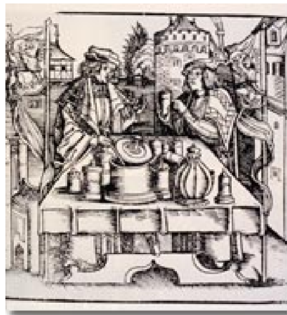
Preparazione della teriaca nel Medioevo