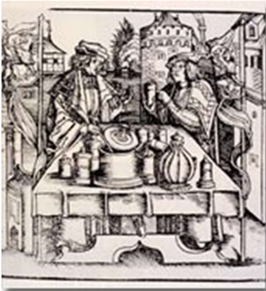
Preparazione della teriaca nel Medioevo