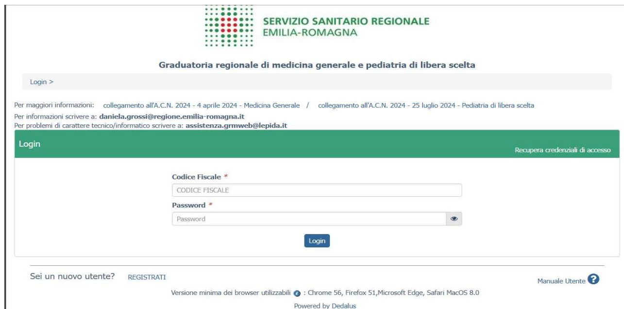
Figura 1 Login e registrazione

Collegandosi al portale viene visualizzata la seguente maschera: