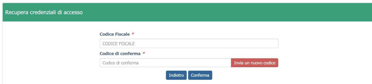
Figura 5 recupero credenziali