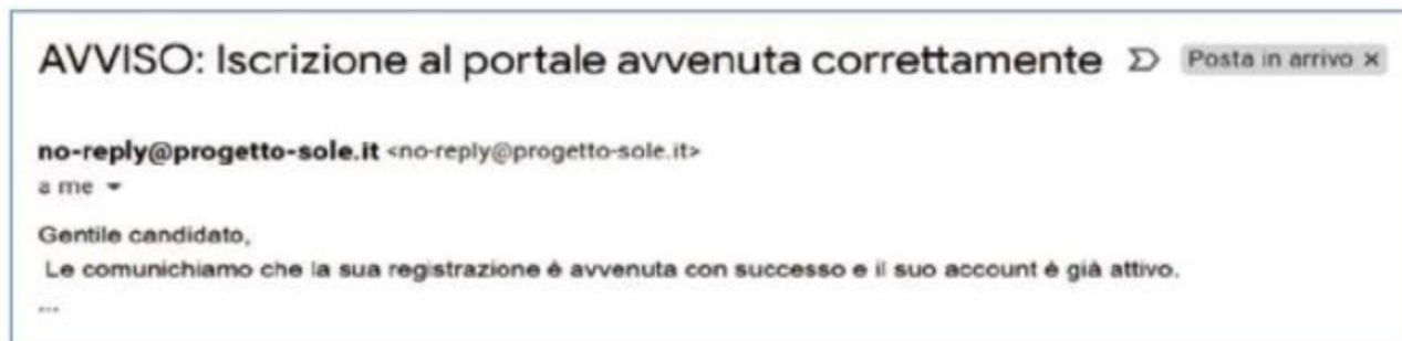
Figura 4 - avviso e-mail di avvenuta registrazione