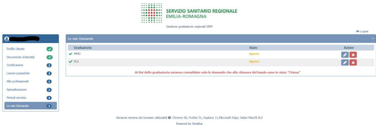
Figura 21 – le mie domande

Dopo avere compilato in maniera corretta tutti i menù precedenti, è possibile presentare la domanda di ammissione in graduatoria.