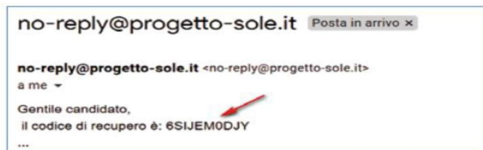
Figura 6 - richiesta codice OTP