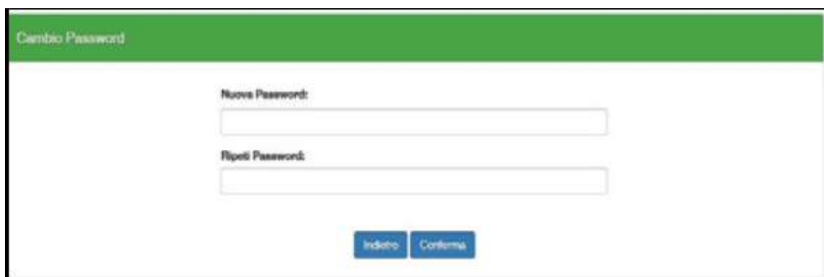
Figura 8 - cambio password