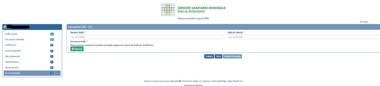
Figura 35 domanda PLS: caricamento bollo

Il sistema richiede obbligatoriamente anche il codice identificativo del BOLLO (riportato anche sul modulo) e controlla che sia diverso da altri codici identificativi inseriti precedentemente per altre domande.