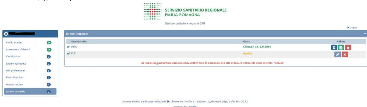
Figura 26 stato delle domande e dati riepilogativi di una domanda chiusa

Nella sezione "Le mie domande" è possibile visualizzare lo stato di tutte le domande presentabili dal candidato (figura 26).