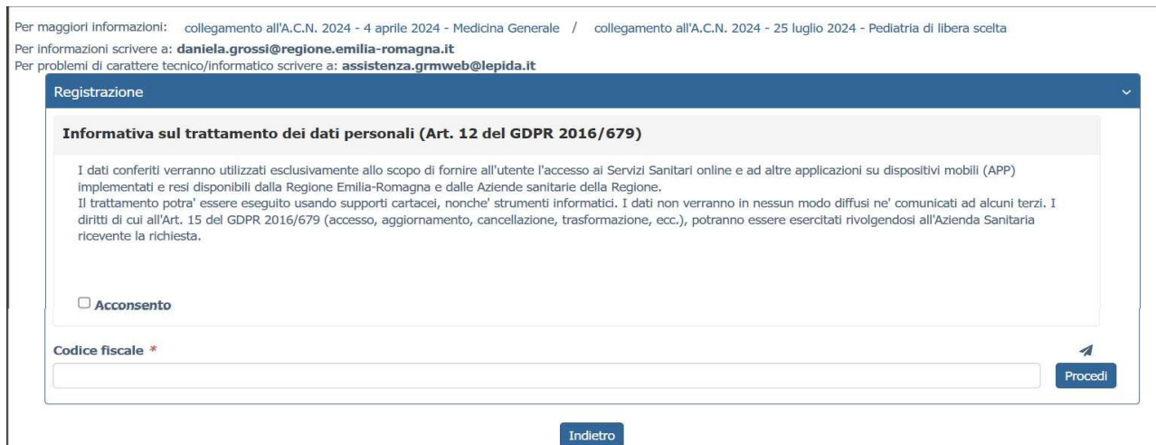
Figura 2 - Informativa sul trattamento dei dati personali

Selezionando REGISTRATI si apre la schermata per la registrazione che mostra l'informativa sul trattamento dei dati personali a cui, dopo averne presa visione, occorre dare il consenso per poter procedere con la registrazione.